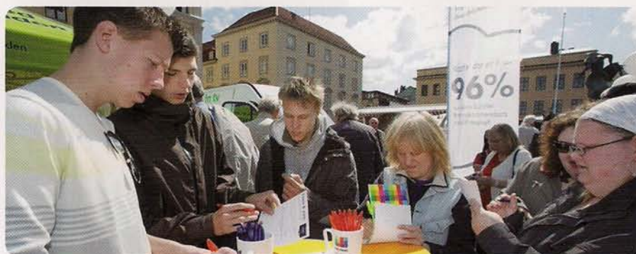
En solig lördag i maj på Stora Torget i Linköping informerade Stångåstaden, Com Hem och Östgöta-Corren om alla nya tv-tjänster. 1 000 personer besökte tälten och fick tjänsterna demonstrerade eller deltog i frågesport.

Vi arbetar för att införandet av de nya systemen ska påverka servicekvaliteten så lite som möjligt och i det långa loppet erbjuda en högre servicegrad.